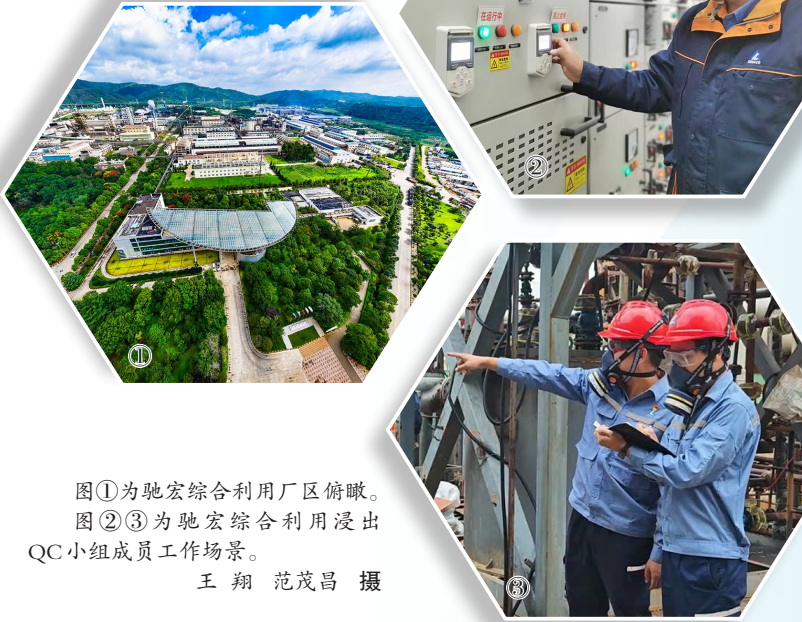
图①为驰宏综合利用厂区俯瞰。 图②③为驰宏综合利用浸出QC小组成员工作场景。

凭借显著的经济效益和行业推广价值,浸出QC小组荣获2025年度全国有色金属行业“优秀(特级)质量管理小组”称号,“降低湿法焙烧钴渣渣量”成果获评2025年度全国质量管理小组一等奖。