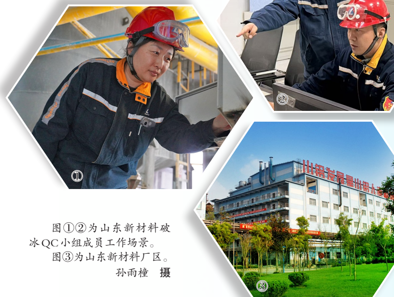
图①②为山东新材料破冰QC小组成员工作场景。 图③为山东新材料厂区。

功夫不负有心人,经过数月持续攻坚,破冰QC小组质量提升成果显著:沸石分子筛一检合格率提升至95%以上,并长期保持稳定,创造直接经济效益90余万元。该小组“提高沸石分子筛一检合格率”成果获评2025年度全国质量管理小组一等奖。