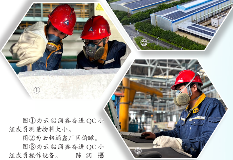
图①为云铝涌鑫奋进QC小组成员测量物料大小。 图②为云铝涌鑫厂区俯瞰。 图③为云铝涌鑫奋进QC小组成员操作设备。

在小组成员的紧密合作和精心筹划下,设备改造投用后,成效显著:电解质返回料系统每月停机时长锐减,系统运行效率大幅提升。亮眼数据的背后,是实打实的效益与温度:直接创效近15万元,系统运行效率提升46%,员工劳动强度降低50%,创新研发的过载保护装置突破传统热继电器性能局限,成功推广应用于天车加料等多个生产场景,为行