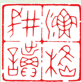
篆刻 鱼樵耕读 山东铝业 路斌