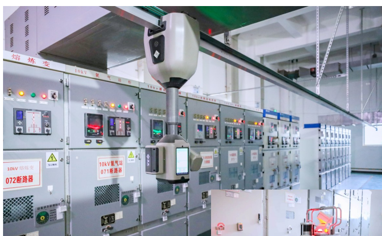
图为易门铜业轨道式机器人(上)和四足机器狗(右)工作场景。

此次智能化升级是易门铜业深耕数智化建设的重要里程碑。下一步,易门铜业将持续优化巡检策略,完善巡检数据库,不断提升电力运维智能化水平,以数智创新破解生产难题,赋能高质量发展,为有色金属冶炼行业电力运维智能化提供可复制、可推广的实践经验。