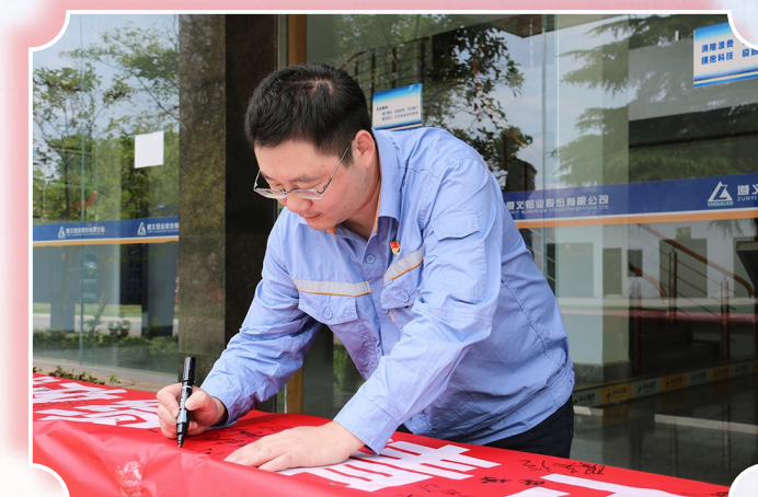
图为遵义铝业员工在廉洁从业横幅上签名。