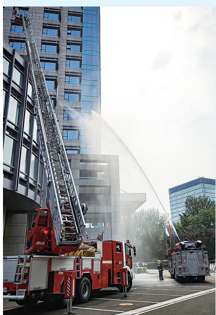
图为中铝集团总部开展消防疏散演练。

本报讯 为扎实推进“安全生产月”活动走深走实,连日来,中铝集团各单位紧紧围绕“人人讲安全、个个会应急——排查整治风险隐患”主题,深入排查整治风险隐患,广泛开展安全宣传教育和安全演练活动,全面提升职工应急处置能力,筑牢安全生产坚实屏障。