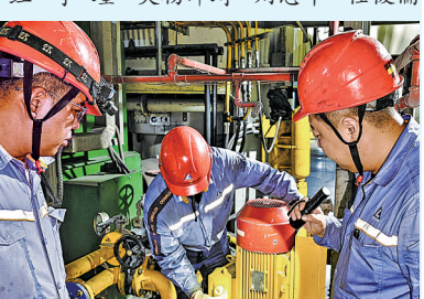
图为银星发电开展“隐患通报令”专项安全竞赛。