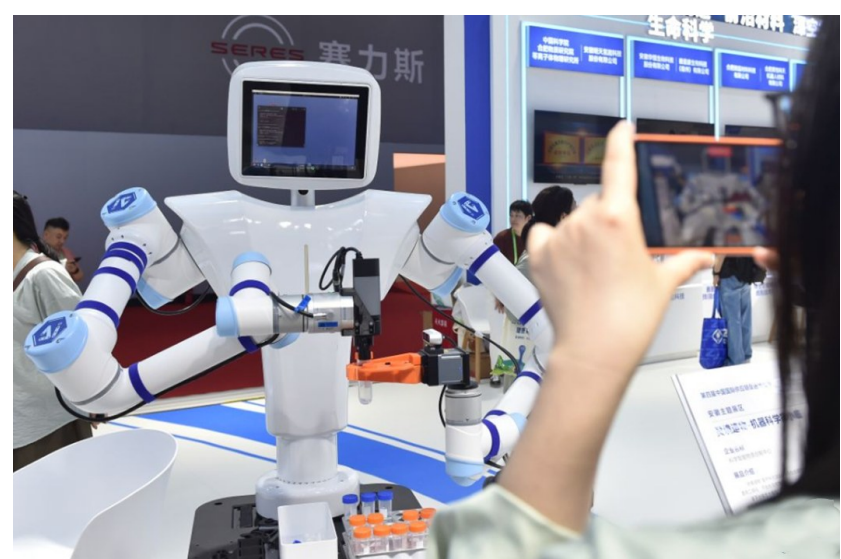
图为6月24日，在链博会清洁能源展区安徽省主题形象展台，参观者给“灵境造物-机器人科学家小临”拍照。

聂平香总结道，六条新图谱精准勾勒全球供应链重构的三大维度——前沿技术竞速、大宗商品安全与物流基础升