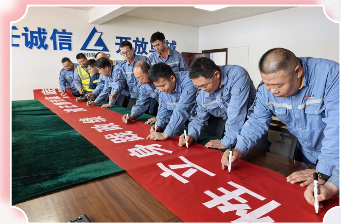
图为山西华兴员工在廉洁从业承诺书上签名。