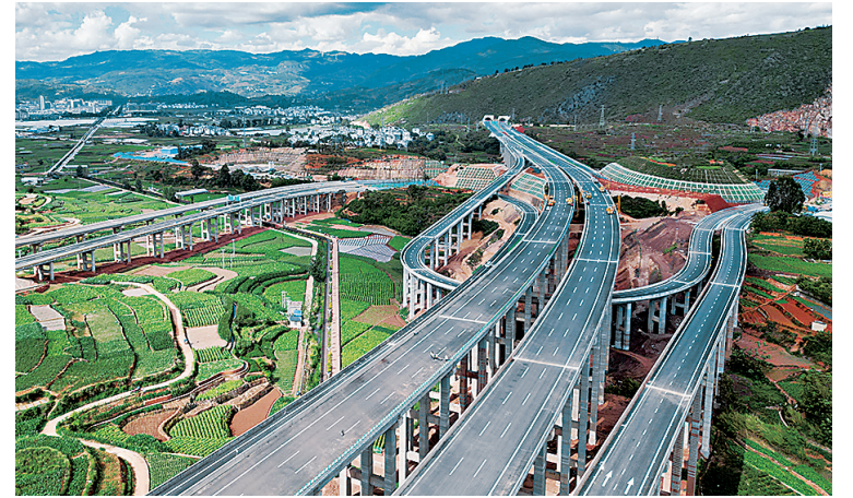
图为弥玉高速华宁互通立交。