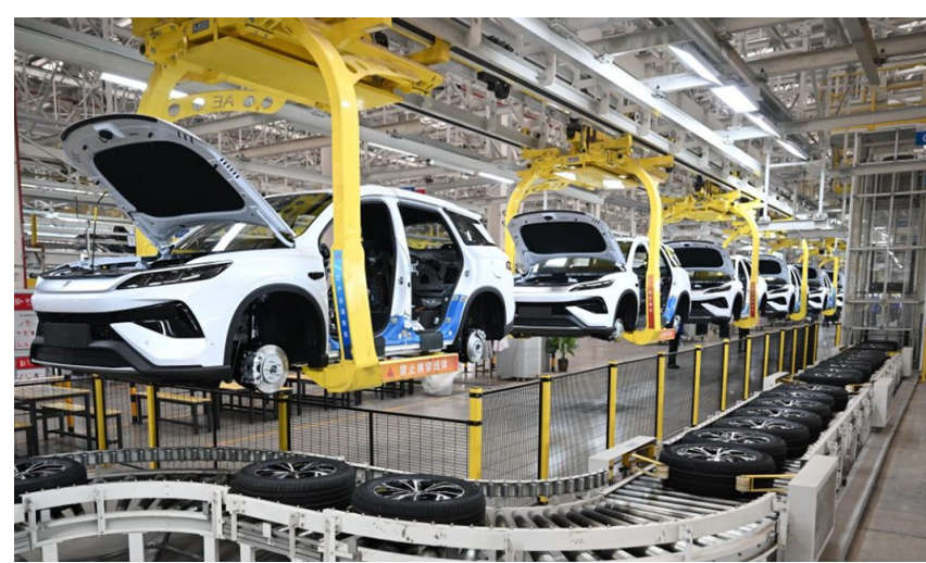
图为郑州航空港区比亚迪总装工厂新能源汽车“宋Pro”生产线。

通消费改革试点，通过“揭榜挂帅”的方式，在全国范围择优确定了40个试点城市，支持地方围绕汽车后市场，以及新车消费、二手车流通、报废车回收利用等环节，聚焦短板堵点，因地制宜改革创新，先行先试，推动形成各具特色的试点成果。