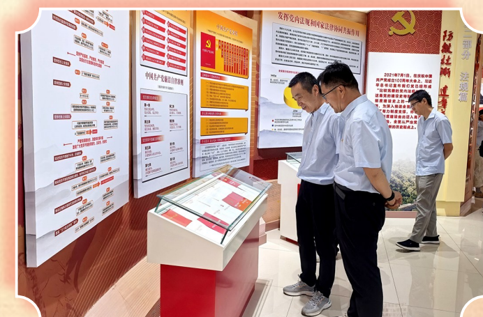
图为银星发电组织员工在宁夏回族自治区警示教育中心开展沉浸式学习。