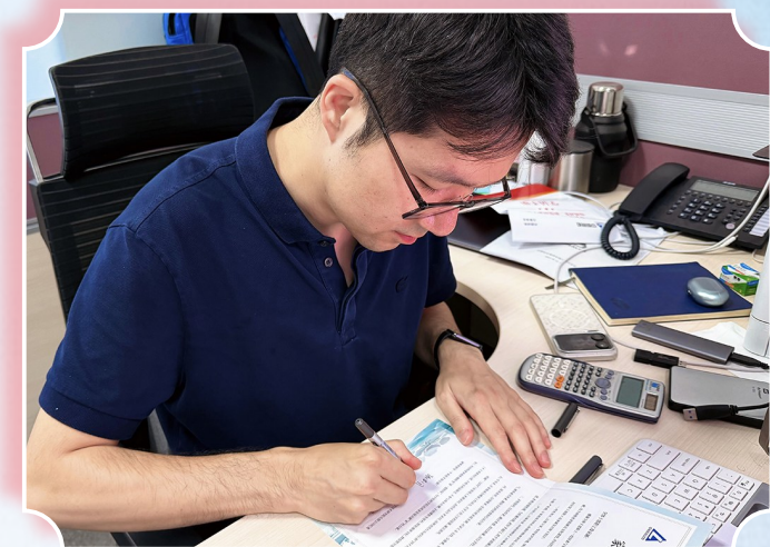
图为中铝科学院员工在廉洁承诺书上郑重签名。