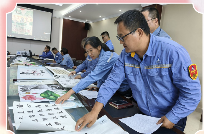
图为云铝文山员工展示自创的廉洁文化作品,以艺术形式传递以廉为荣、以贪为耻的价值理念。