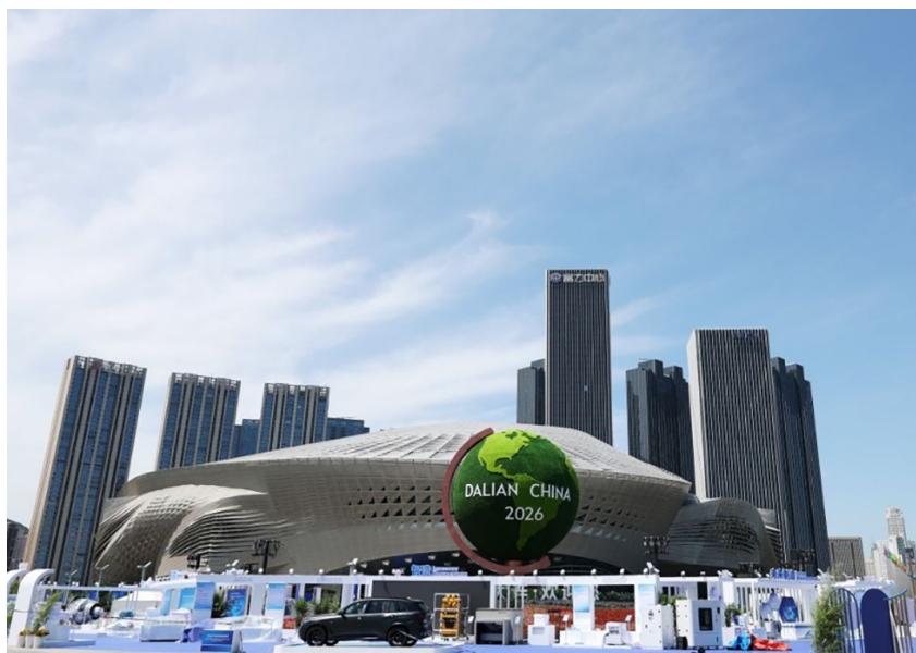
图为2026夏季达沃斯论坛主会场大连国际会议中心。

在中欧数字协会主席路易吉·甘巴尔代拉看来，“规模化创新”直指当今时代关键挑战。“如何将新技术转化为生产